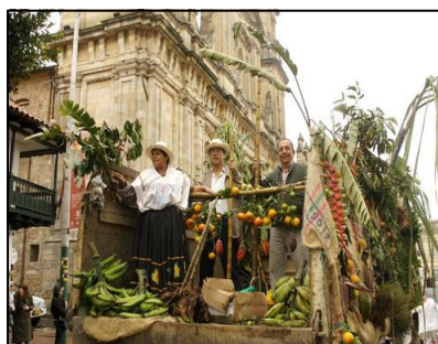
“Día del Campesinado”, Plaza de Bolívar - junio 22 de 2007.